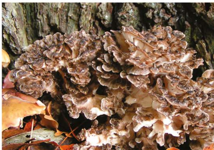
Maitake; Grifola frondosa