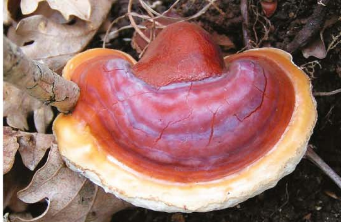
Reishi; Ganoderma lucidum

CordyChi je odlična kombinacija gljiva Cordyceps i Reishi i njihovog međusobnog ljekovitog djelovanja. Ovaj prirodan tonik povećava imunitet i izdržljivost organizma te pomaže krvožilnom, imunološkom i respiratornom sustavu.