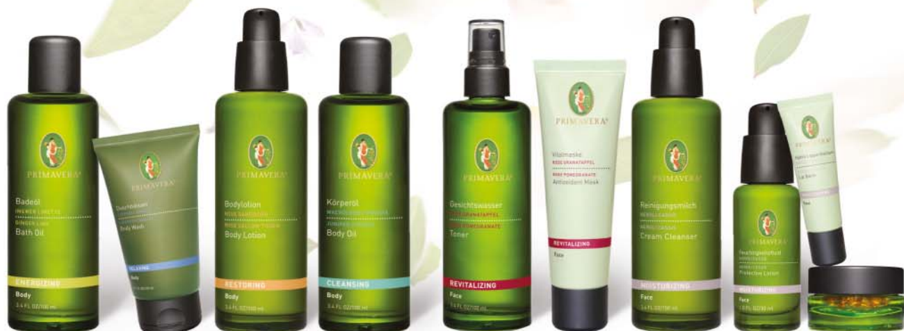
Primavera proizvodi za njegu lica i tijela